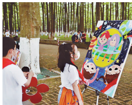
展览现场

武汉市文联党组书记、副主席李蓉,武汉市妇联党组书记、主席魏静等出席了展览开幕式,魏静为参展的小画家们颁发参展证书。开幕式上,少先队员为到场的嘉宾献上了鲜艳的红领巾,展现社会主义接班人的