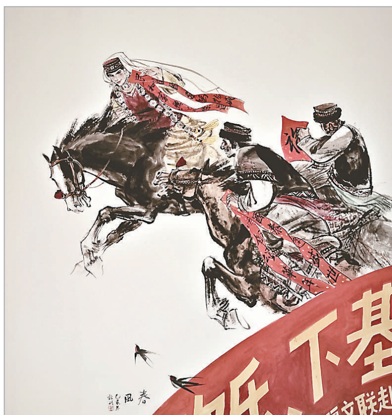
春风(中国画) 郅振明

2011年,郅振明的《英雄史诗——玛纳斯》成功入选“中华文明历史题材美术创作工程”。经过三年筹备,当作品主题、意境、整体布局、细节均已成竹在胸时,他开始了正式创作,为了创作这件高5米,画芯长4.7米、宽2.2米的巨幅工笔画,郅振明添置了带轮子的云梯和垫子,画高处时踩在梯子上,画低处时蹲着,甚至趴在地上的垫子上。而曾参加“不忘初心 牢记使命——庆祝中国共产党成立100周年美术作品展览”并被中国共产党历史展览馆收藏的《丹心照昆仑》亦是他的代表作。触发他创作灵感的是一张摄于1949年12月17日的黑白照片:新疆省人民政府、新疆军区成立,彭德怀、王震、张治中、陶峙岳等在迪化南门大银行门前台阶上站立检阅部队入城的场景。“如果直接将这个历史画面搬到画面上,可能比较容易创作。但我觉得,把历史人物放在具有新疆特征的时空背景中应该更有表现力和意义。”郅振明说。为了创作这幅画,他翻阅了不少资料,反复琢磨人物的面目