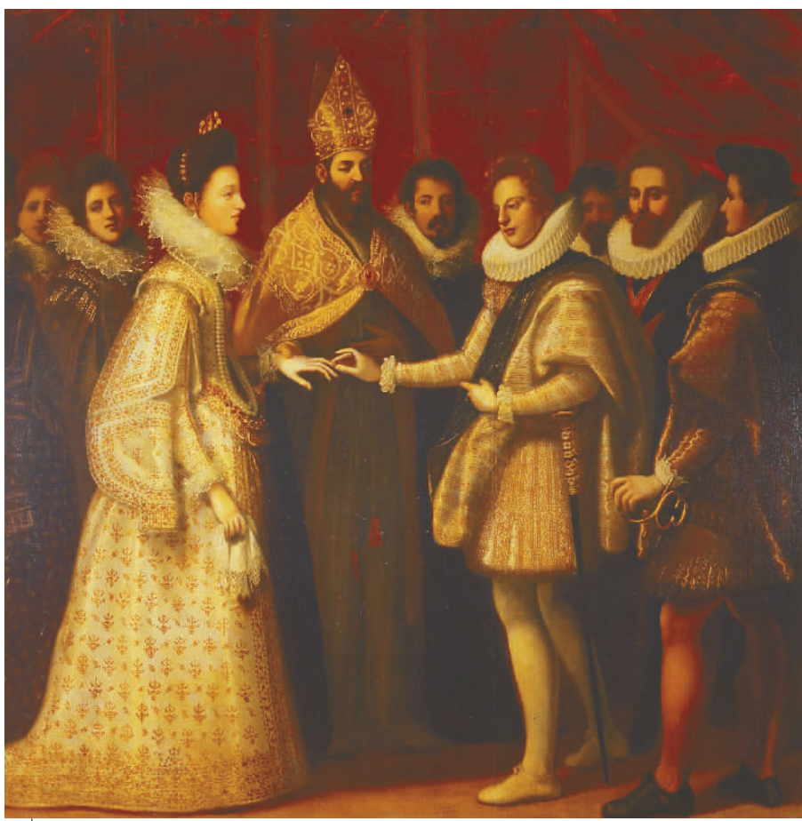
埃莱奥诺拉·德·美第奇与文琴佐·贡扎伽的婚礼(布面油画) 雅各布·基门蒂 乌菲齐美术馆收藏

查理五世1548年委托提香绘制了这样一幅身穿铠甲的肖像，之后欧洲贵族们不断向提香和他的工作室要求复制该肖像。提香绘制的原作和其他复制品都已经不存在了，这是唯一存世的一幅。