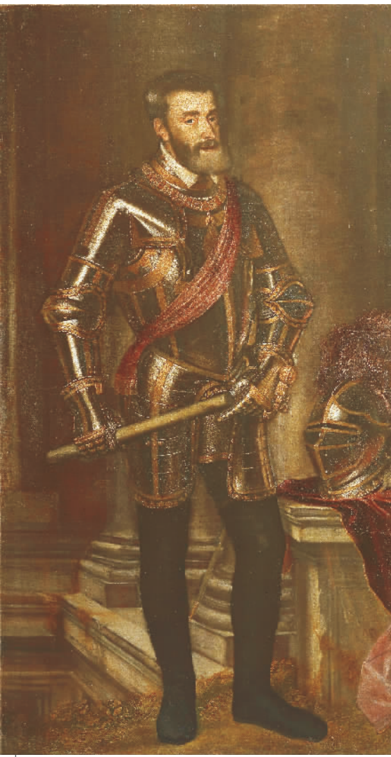
戎装的查理五世(布面油画) 提香·韦切利奥及其工作室 乌菲齐美术馆收藏

这幅木板油画描绘的是意大利最伟大的诗人、西欧文学巨擘之一——但丁(1265年-1321年)。与纪念章一样，我们看到的只是诗人的侧面，头上戴着月桂树枝条编制的桂冠，象征其诗歌创作上的成就。