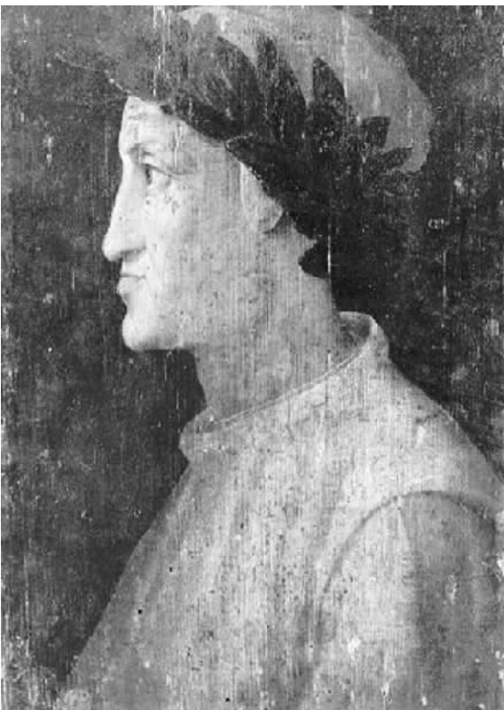
但丁肖像(木板油画) 托斯卡纳大区的工作室 圣马太国家博物馆收藏

通过这些藏品，观众将更直观、更真实地理解意大利文艺复兴时期的文化和艺术。“这个展览绝不仅仅是欣赏性的展览，而是通过文艺复兴时期的艺术和生活，展现当时人们的生活风貌，从而和传统的中国文化达到文明共鉴的目的。”黄雪寅说。